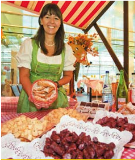
Genießen Sie am Weltspartag regionale Spezialitäten.

Wir bieten Ihnen am Weltspartag während der Schalteröffnungszeiten regionale Spezialitäten vom Bauernbuffet Nagl aus Axams zum Ver-